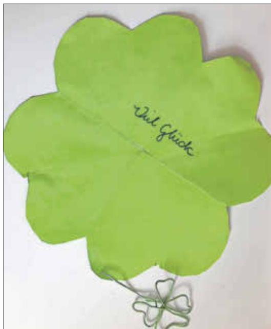
Gestaltet von den Kindern der Outdoorgruppe

Viel Glück im neuen Jahr, wünschen die Kinder und Erzieherinnen der Kindertagesstätte „Kleine Wüstenfüchse“ Allen Kindern, Eltern, Sponsoren und Freunden viel Gesundheit und ein erfolgreiches 2021.